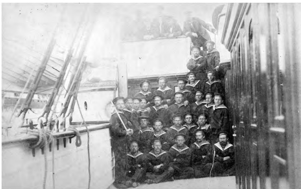
Besætningen på S/S Dannebrog 1887

Den 19. november kom kongen med følge om bord, de gik fra borde næste dag. Den 25. november blev kommandoflaget strøget for sidste gang dette år.