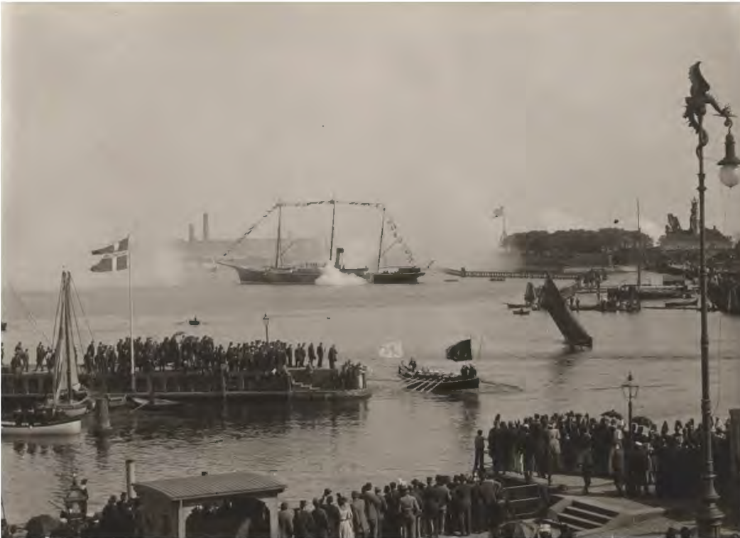
Kejser Alexander III's ankomst til København i 1892. Kejserskibet Czarina set fra Toldboden. En chalup sejler mod land. Kanonsalut talrig menneskemængde i baggrunden th. Holmens vagt Under Kronen.