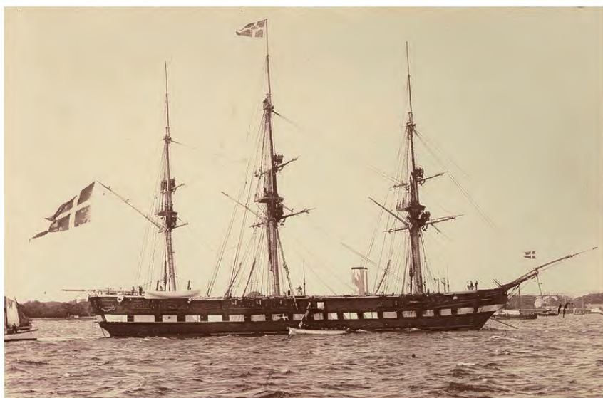
Fregatten Jylland ankret op i Københavns Havn med chalup