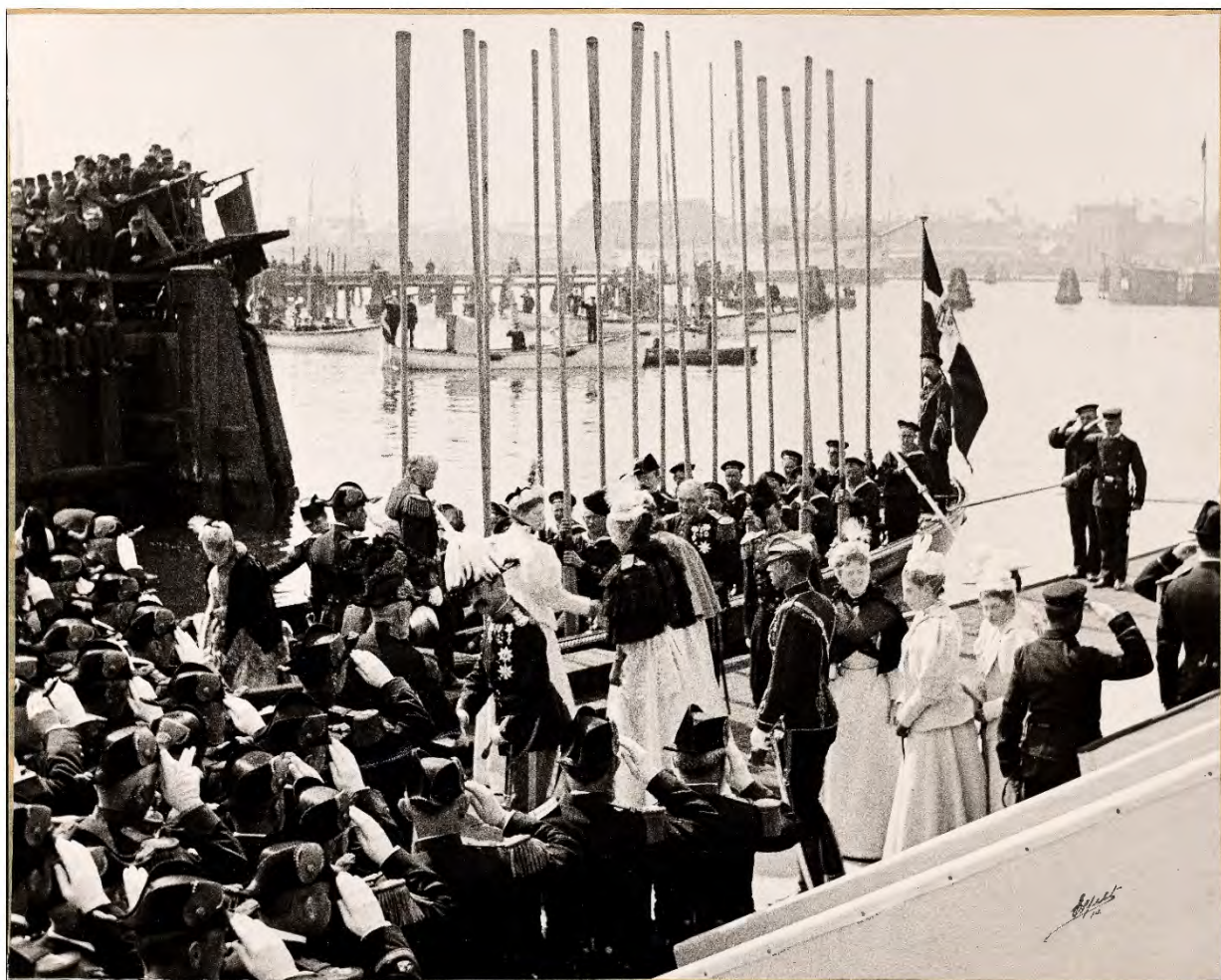
Billedet viser Chr.IX ankommet til Orlogsværftet Holmen i Chalup forud for stabelafløbningen 1895.