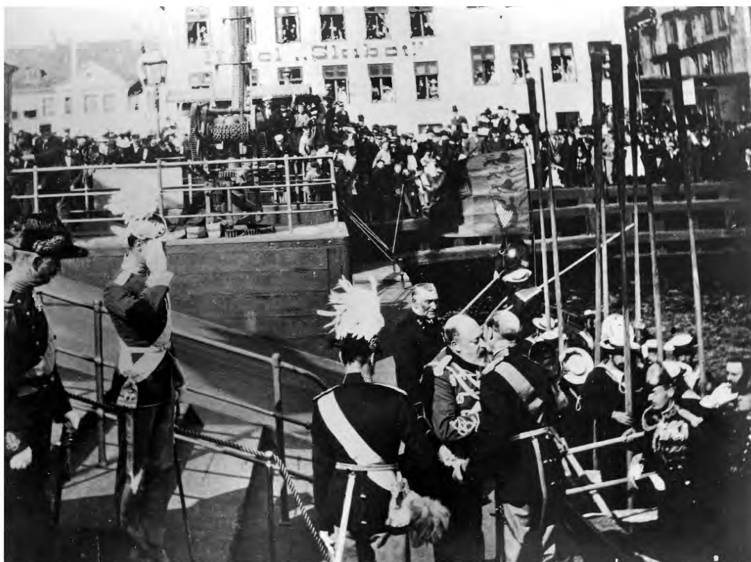
Kongebesøg i Helsingør, ca. 1900. Den britiske Kong Edward (VII), den danske Kong Christian IX, Prins Frederik (VIII), Prins Christian (X) og Prins Hans hilser på hinanden.

Når S/S Dannebrog (1) lagde an ved havne rundt om i Danmark og i fremmede lande, brugte man chaluppen til at transportere værter og gæster til og fra kongeskibet. Tilsvarende ved besøg af fremmede kongeskibe blev de prominente gæster sejlet fra skibet af bemandede chalupper, som var en fast del af skibenes udstyr.