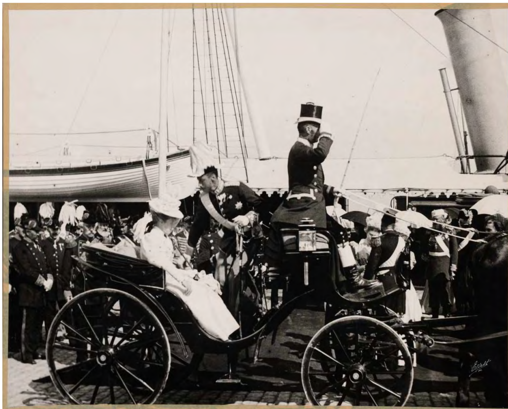
Kejserinde Dagmar på besøg 1897.

Der var arrangeret sejlture for kongens udenlandske gæster og familie med det danske kongeskib under besøgene. Nedenfor ses kejserinde Dagmar køre væk fra Toldboden efter et ophold på det danske kongeskib. Til venstre i billedet ses skibets ”kongelige rejsechalup” hænge på skibssiden.