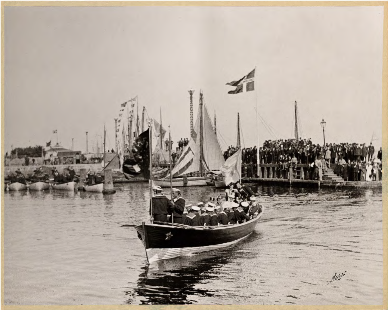
Her ses Kejserinde Dagmar og Kejser Nikolaus i chalup ved Toldboden i 1896.

Ovenfor ses en chalup, som hørte til den russiske Zars skib, transportere kejseren og kejserinden til modtagelse i København i 1896. Chaluppen førtes af 16 mand. Det var en talrig folkeskare som stod parat til at modtage gæsterne.